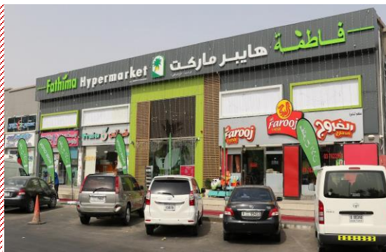
Emirates Cooperative Society